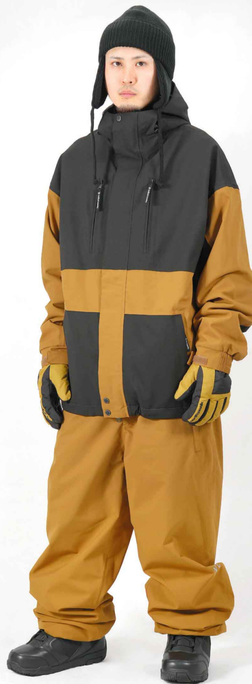
JACKET : SPJ-3220 PANTS : SPP-4220 モデル身長 : 173cm 着用サイズ : L