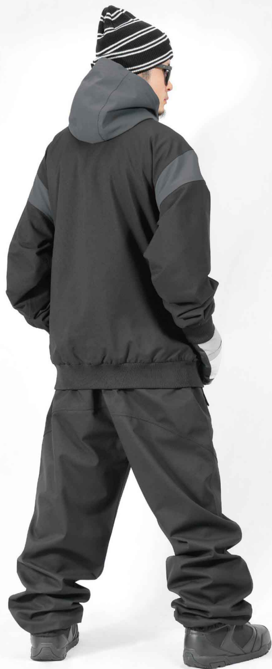
JACKET : SPJ-3240 PANTS : SPP-4210 モデル身長 : 173cm 着用サイズ : L