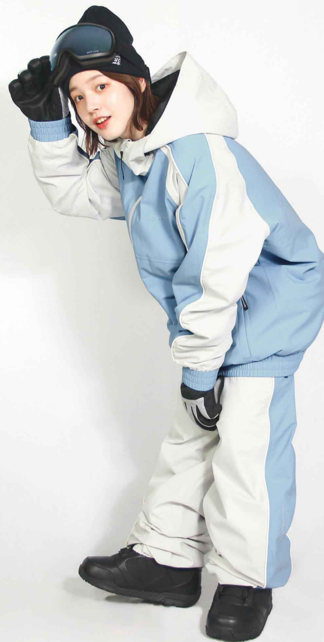
JACKET : SPJ-3230 PANTS : SPP-4230 モデル身長 : 160cm 着用サイズ : L