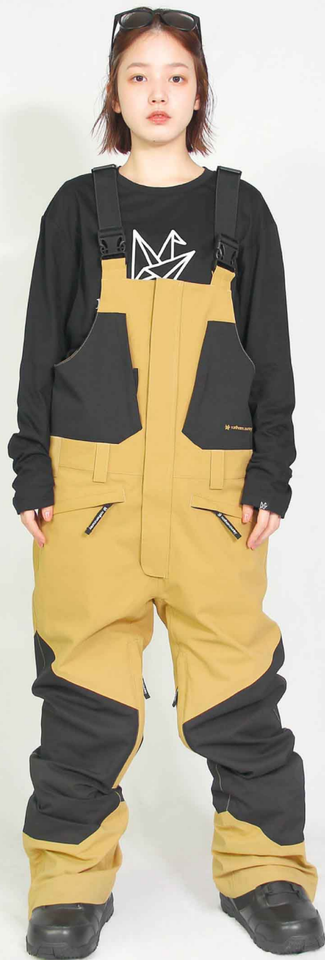
PANTS : SPP-4240 モデル身長 : 160cm 着用サイズ : S