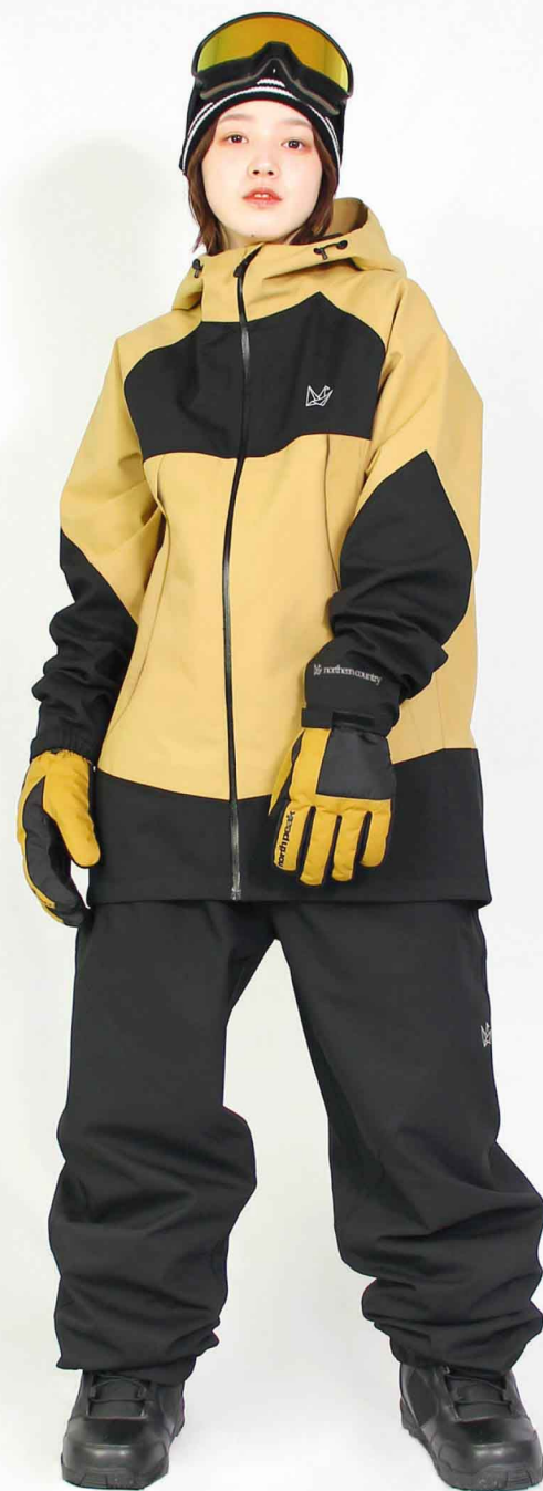
JACKET : TR-1601 PANTS : SPP-4210 モデル身長 : 160cm 着用サイズ : JKT/S PNT/L