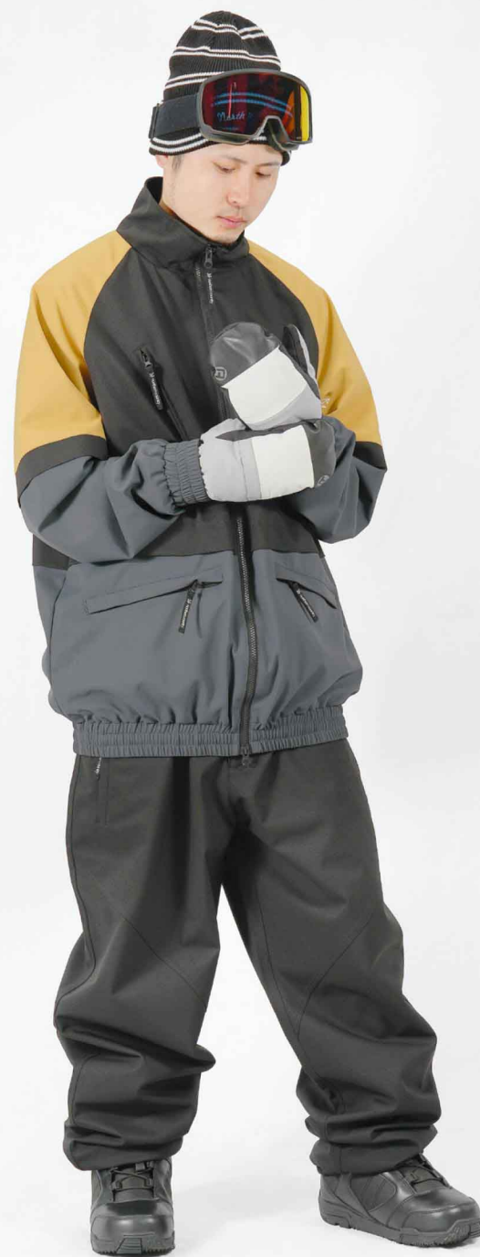
JACKET : SPJ-3250 PANTS : SPP-4210 モデル身長 : 173cm 着用サイズ : L