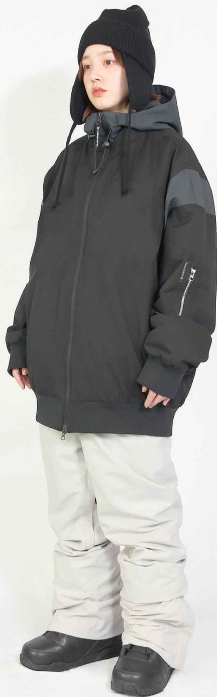
JACKET : SPJ-3240 PANTS : SPP-4250 モデル身長 : 160cm 着用サイズ : JKT/L PNT/S