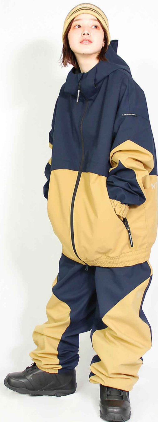
JACKET : SPJ-3210 PANTS : SPP-4210 モデル身長 : 160cm 着用サイズ : L