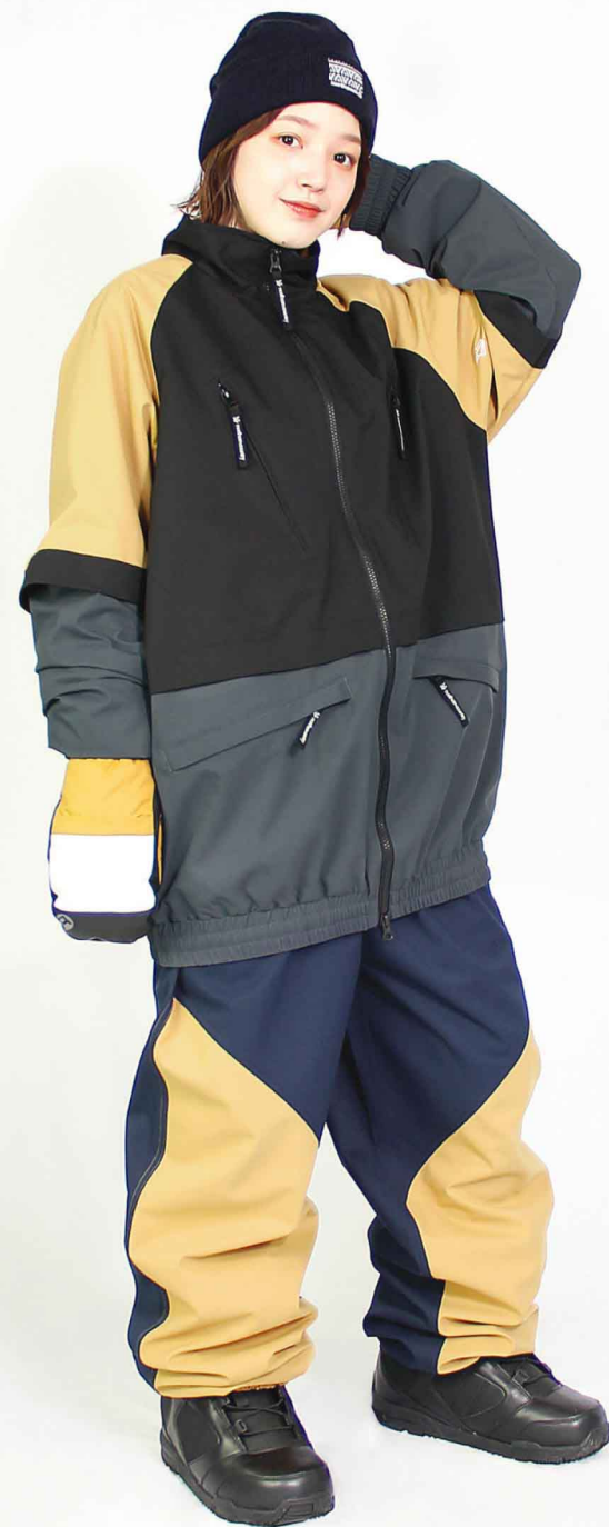
JACKET : SPJ-3250 PANTS : SPP-4210 モデル身長 : 160cm 着用サイズ : L