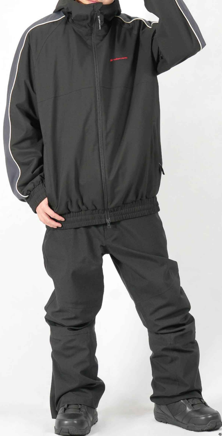
モデル身長：173cm 着用サイズ：L

northern country定番のスノーボードパンツ。 膝部分の立体縫製による運動性に配慮した設計や、 パウダーガード・シームテープ加工・ストレッチ生地など、 こだわりの機能性はそのままに、よりシンプルに再設計。