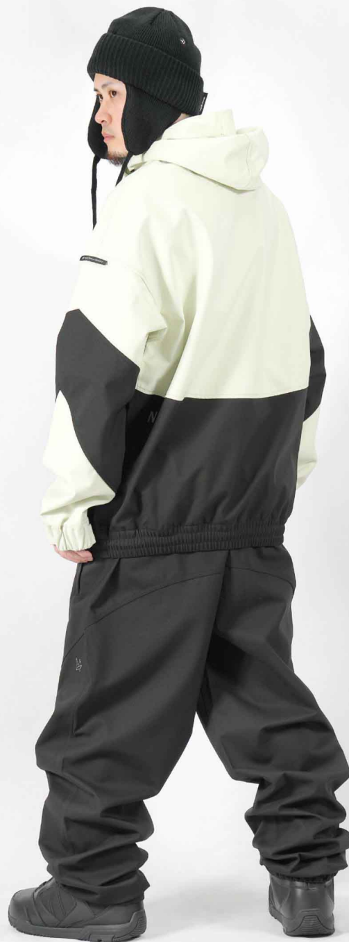
JACKET : SPJ-3210 PANTS : SPP-4210 モデル身長 : 173cm 着用サイズ : L