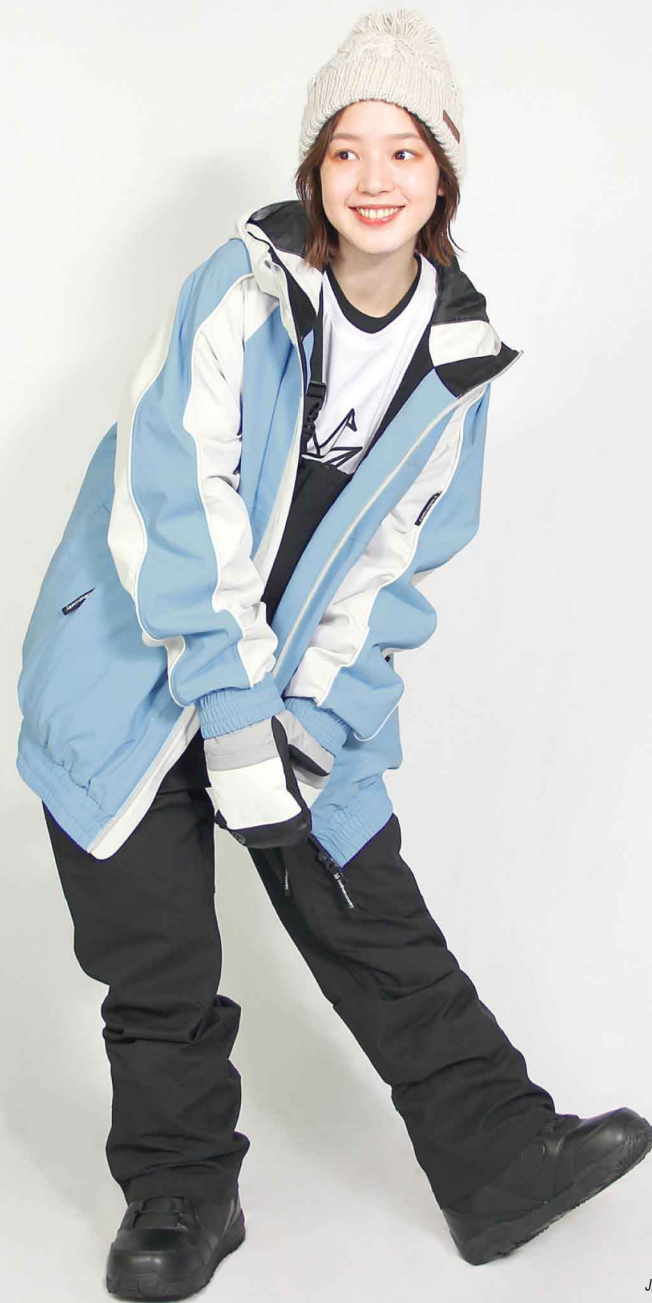
JACKET : SPJ-3230 PANTS : SPP-4240 モデル身長 : 160cm 着用サイズ : L