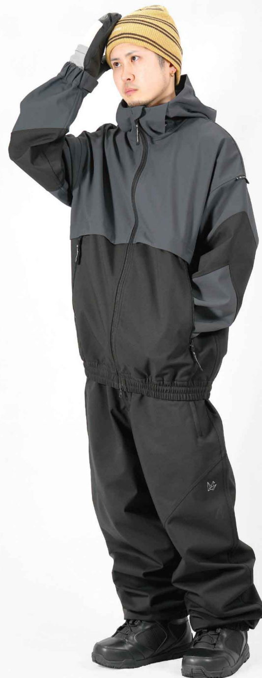
JACKET : SPJ-3210 PANTS : SPP-4210 モデル身長 : 173cm 着用サイズ : L