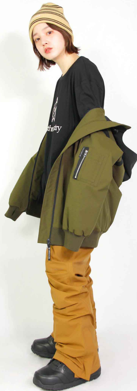
JACKET : SPJ-3240 PANTS : SPP-4250 モデル身長 : 160cm 着用サイズ : JKT/S PNT/L