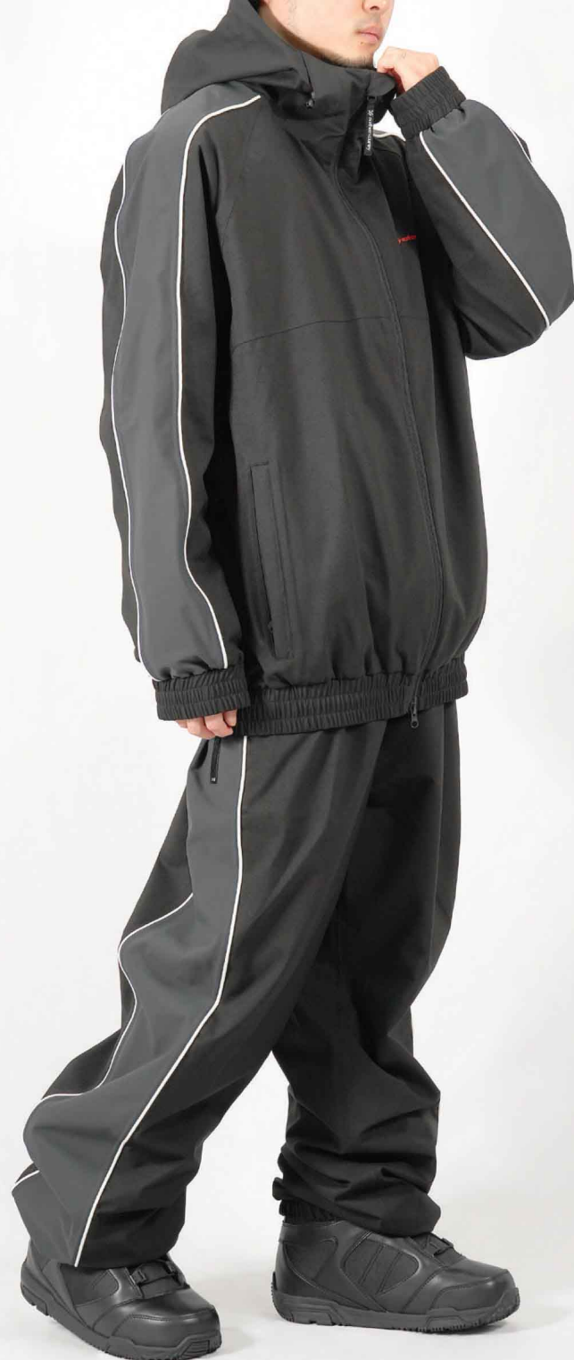
モデル身長：173cm 着用サイズ：L

“FAT LINE”が特徴的なジョガーパンツ。 セットアップで合わせたいアイテム。 ジョガーなのに機能が満載なパフォーマンス重視タイプ。 生地、シルエット共に、ストリートな感覚でコーデにも“FUN(楽しみ)”をプラス。