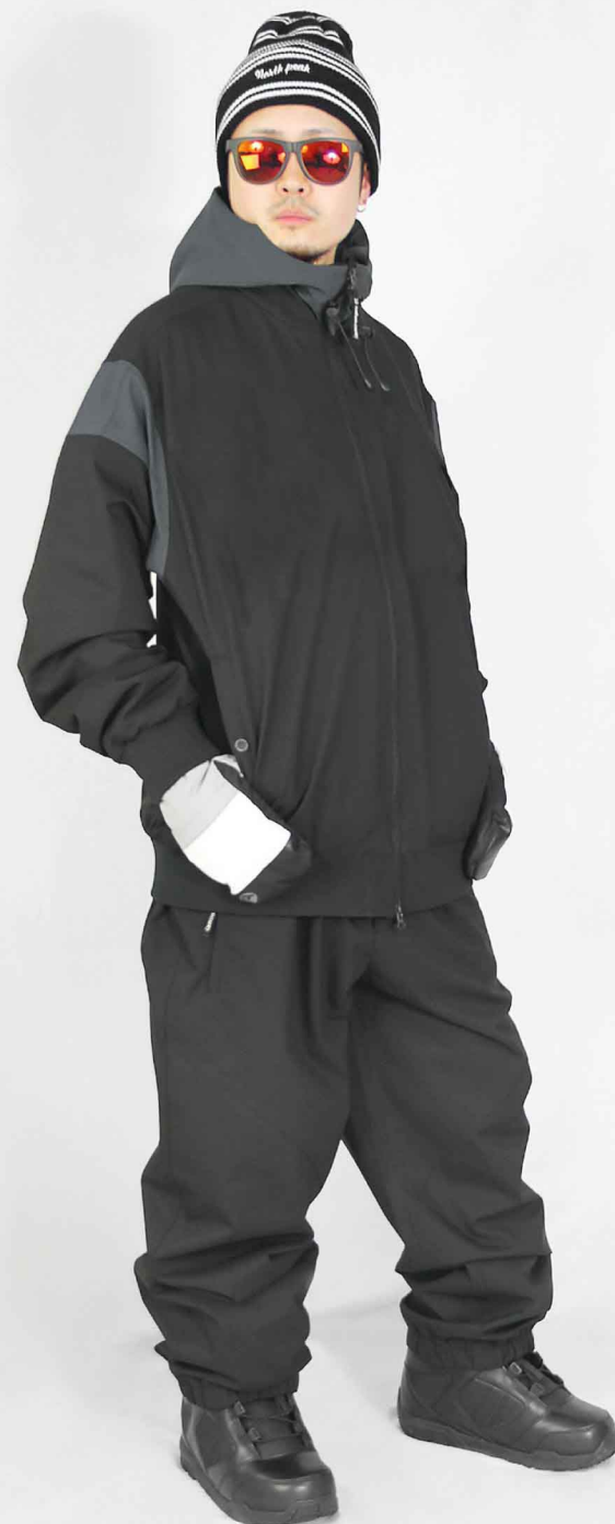
JACKET : SPJ-3240 PANTS : SPP-4210 モデル身長 : 173cm 着用サイズ : L