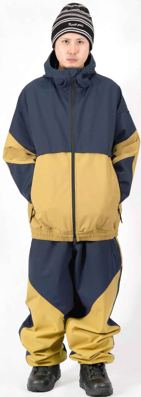
JACKET : SPJ-3210 PANTS : SPP-4210 モデル身長 : 173cm 着用サイズ : L