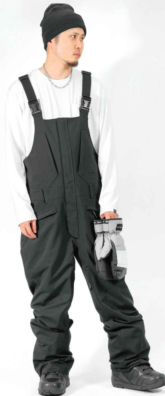
PANTS : SPP-4240 モデル身長 : 173cm 着用サイズ : L