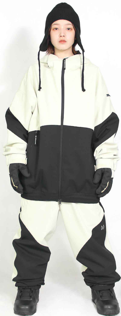
JACKET : SPJ-3210 PANTS : SPP-4210 モデル身長 : 160cm 着用サイズ : L