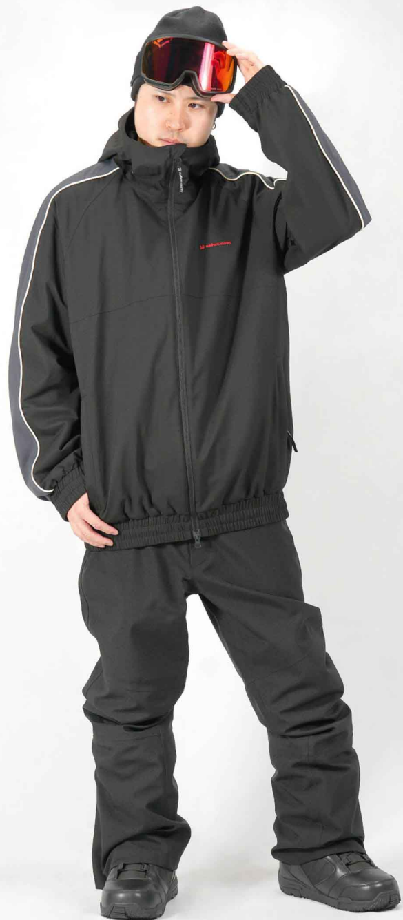
JACKET : SPJ-3230 PANTS : SPP-1150 モデル身長 : 173cm 着用サイズ : L