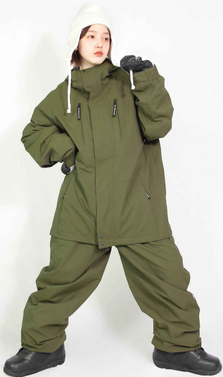
JACKET : SPJ-3220 PANTS : SPP-4220 モデル身長 : 160cm 着用サイズ : L