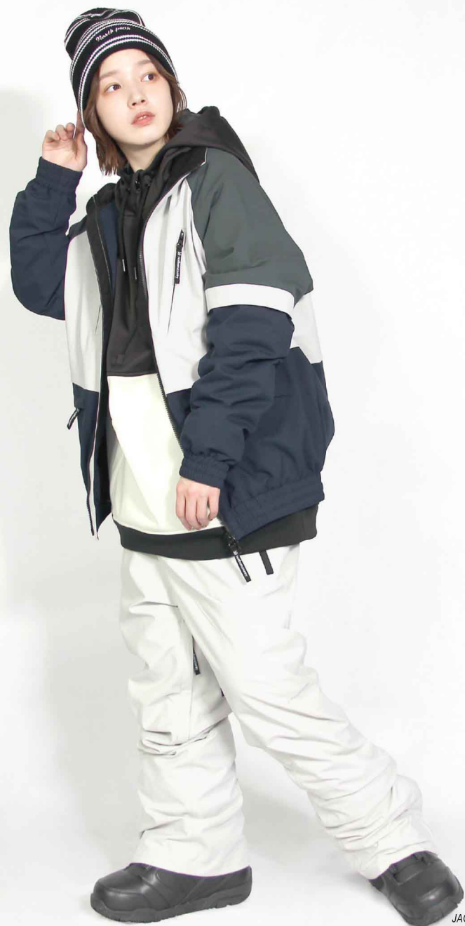
JACKET : SPJ-3250 PANTS : SPP-4250 モデル身長 : 160cm 着用サイズ : S