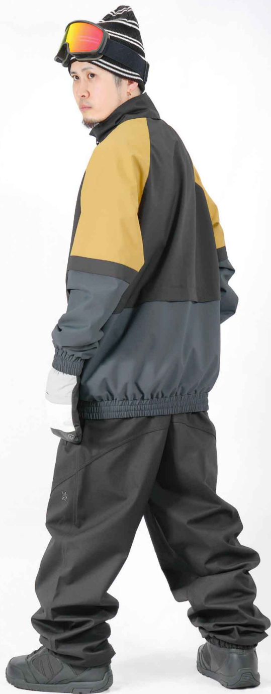
JACKET : SPJ-3250 PANTS : SPP-4210 モデル身長 : 173cm 着用サイズ : L