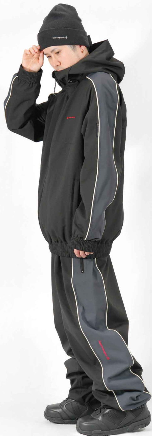
JACKET : SPJ-3230 PANTS : SPP-4230 モデル身長 : 173cm 着用サイズ : L