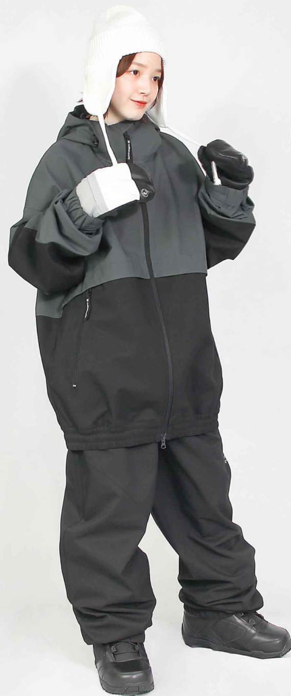
JACKET : SPJ-3210 PANTS : SPP-4210 モデル身長 : 160cm 着用サイズ : L