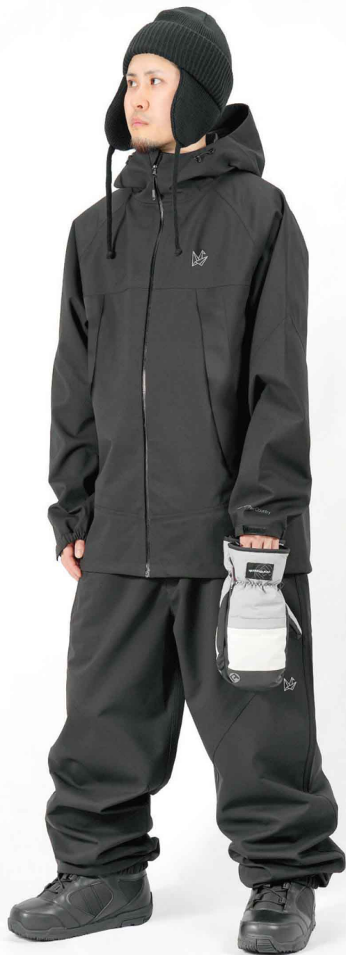
JACKET : TR-1601 PANTS : SPP-4210 モデル身長 : 173cm 着用サイズ : L